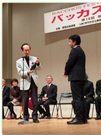
《関西合唱連盟名誉会長賞授与式》